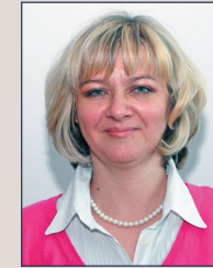
Амела Башић прва замјеница предсједника